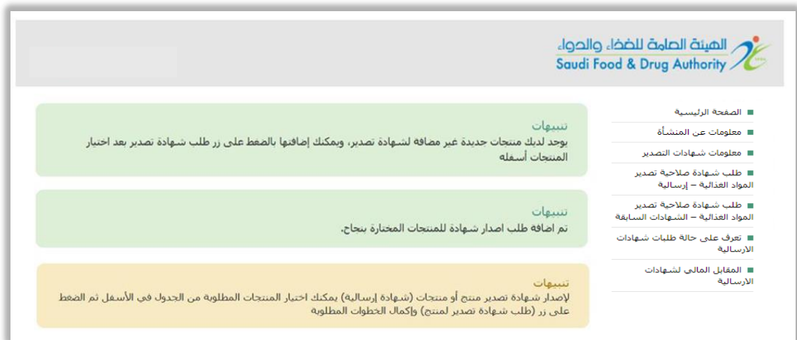
الشكل (13): التنبيهات لإصدار شهادة صلاحية التصدير

تتيح هذه الخدمة لجميع المنشآت الغذائية المحلية بمعرفة تفاصيل التنبيهات لإصدار شهادة صلاحية التصدير شكل (13)