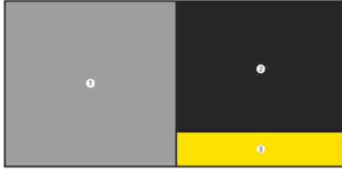
الشكل ٢ نمط متجانب: ١: الصورة، ٢: العبارة، ٣: رسالة الإقلاع

د- في حال كان ارتفاع التحذير الصحي أعلى من ٢٠% لكن أقل من ٦٥% من عرضه، يوضع التحذير الصحي على نمط متجانب حسب الشكل ٢.