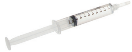
سينرايز مذاب في محقنة 10 مل