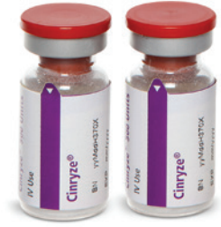
1 أو 2 قنينة سينرايز (500 وحدة دولية لكل منهما)