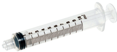
1 حقنة 10 مل أحادية الاستخدام