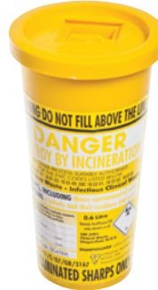
حاوية الأدوات الحادة (غير متضمنة في العبوة)