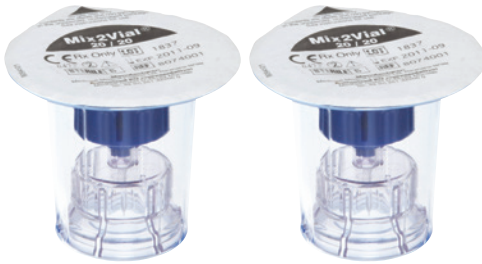
1 أو 2 أجهزة نقل