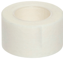
شريط طبي (غير متضمنة في العبوة)