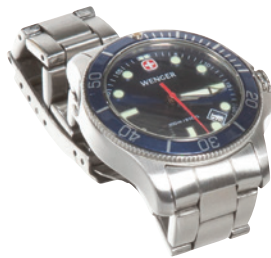
ساعة (غير متضمنة في العبوة)