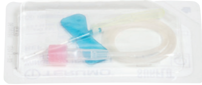
1 مجموعة بزل وريدي (إبرة فراشية مع أنبوب)