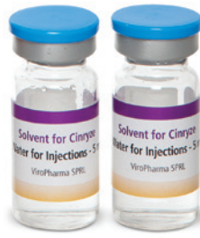
1 أو 2 قنينة ماء للحقن، (مخفف، 5 مل لكل منهما)