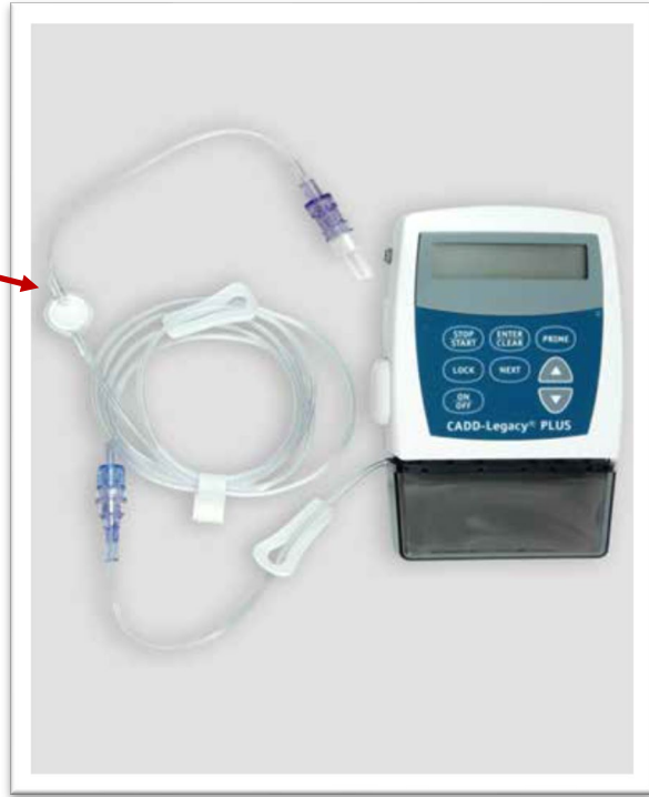
مرشح مدمج قياس 0.2 ميكرومتر

تحتوي بعض الأنابيب على مرشح للقضاء على البكتيريا التي تدخل إلى الجهاز. إذا لم يكن الأنبوب الخاص بك يحتوي على مرشح بالفعل، فيجب إضافة مرشح "مدمج 0.2 ميكرومتر" إلى جهازك بين المضخة ووصلة القسطرة المغلقة. يتم استبداله يومياً (كل 24 ساعة) في نفس الوقت مع أنبوب التسريب وعبوة الدواء.