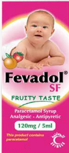
FEVADOL SF 120MG\5ML SYRUP