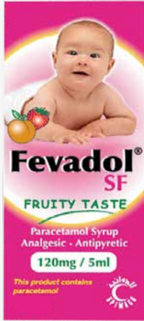
FEVADOL SF 120MG\5ML SYRUP