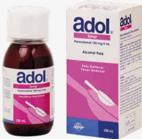
ADOL SYRUP 120MG-5ML