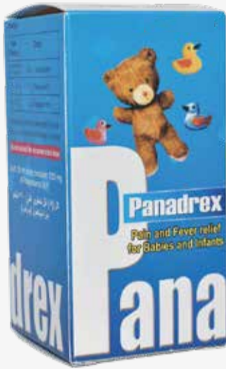
PANADREX 24 MG-ML SYRUP