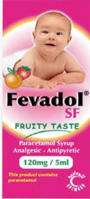
FEVADOL SF 120MG\5ML SYRUP